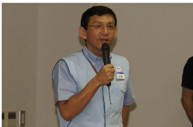
玄藤社長よりご挨拶

ソニー・太陽についてソニー創業者の井深大に始まるソニー・サイエンスプログラムの紹介やインクルージョン・ワークショップの説明など。