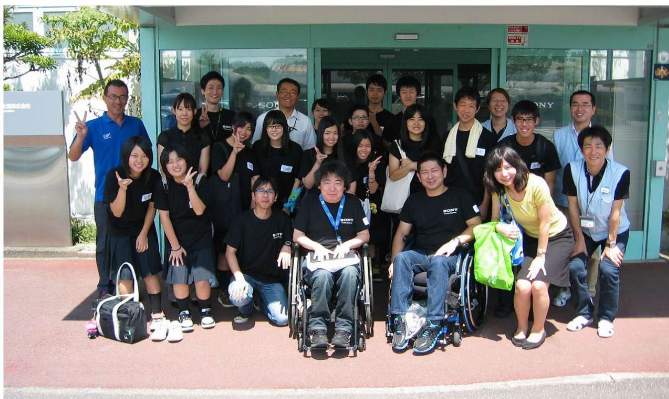
今回協力して頂いた、日出暘谷・総合高校の生徒と先生、スタッフで記念撮影！ ボランティアで参加してくれた生徒の皆さん、ありがとうございました！（人事総務部）