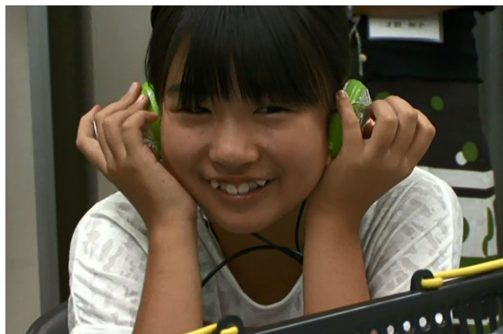
どうやら無事に聞こえているようです♪ やはりここが驚いた事、第1位になりました。