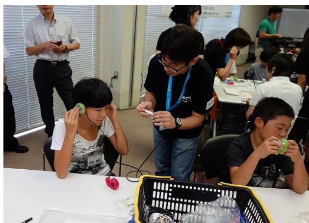
どうかな？ 聞こえるかな？