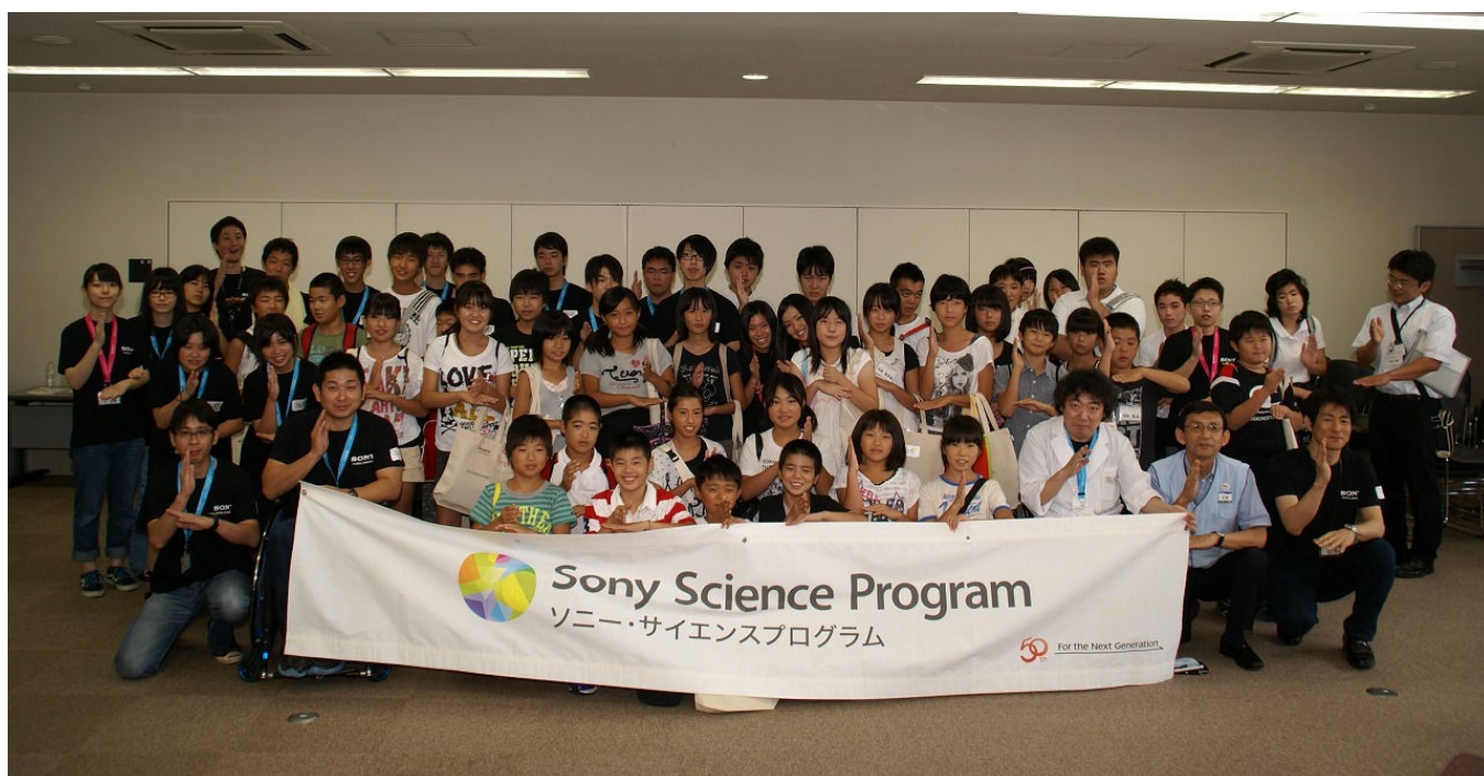
最後にありがとうの手話で記念撮影