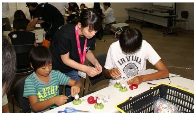
完成までもう少しです。