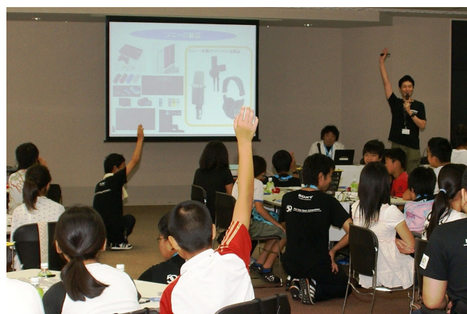
ソニー製品やソニー・太陽についての説明 みんな知っているかな？