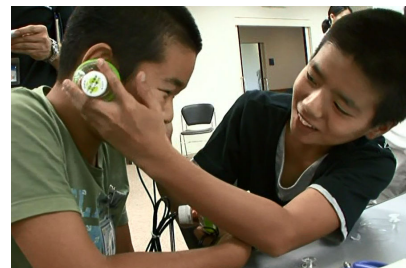
お友達にも聞かせてあげてね！