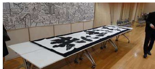
「共に生きる」と書かれた巨大な書道画