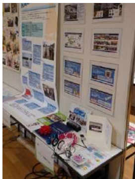
ソニー・太陽の展示ブース

展示ブースでは「インクルージョン・ワークショップ」の活動を紹介し、実際にワークショップの作品を手に取り体感していただいた。ペットボトルで作られたヘッドホンの音楽を聞いた方はそのクリアな音に驚きを見せ、また、ICレコーダーキット「伝言ちゃん」を使って自分の声を録音し楽しむ方もいた。