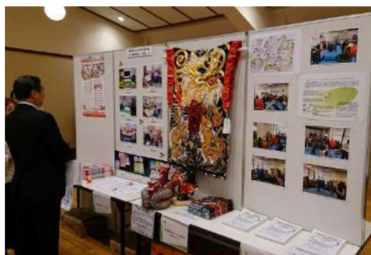
その他の展示の様子