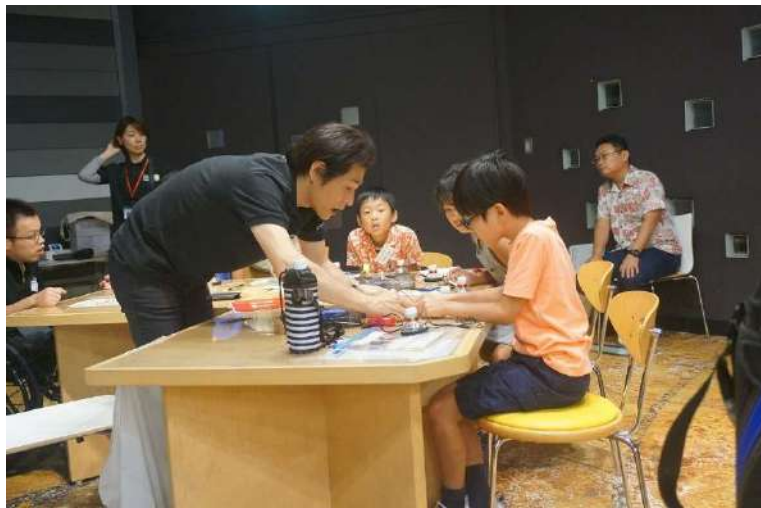
時間に限りがありますので、スタッフのフォローも真剣です。