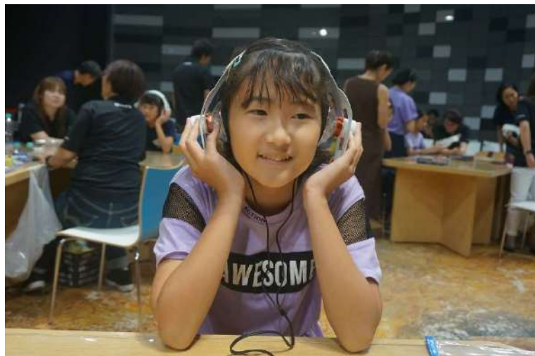
無事に音が鳴り、子ども達も嬉しそうです。